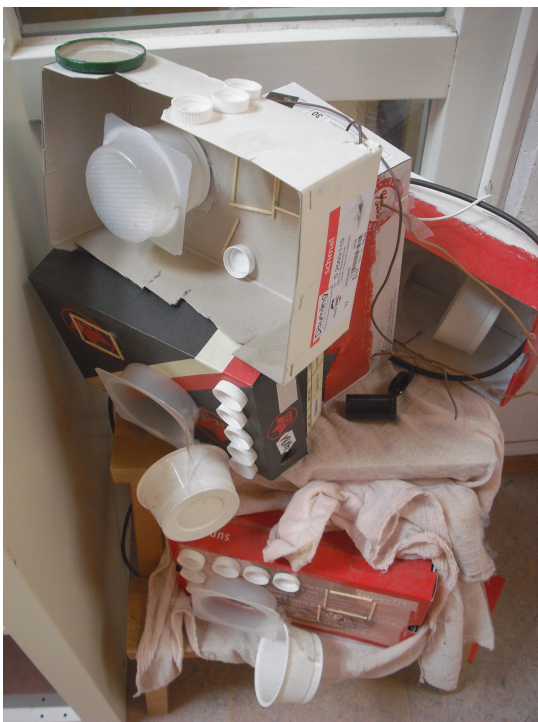
Radios aus der Werkstatt der Kleinsten

Die Kinder sind stark sensibilisiert für die Notwendig, Elektrizität zu gebrauchen und haben eine subjektive Vorstellung von „Strom“ entwickelt. Die „Stromwächter“-Aktion ist angelaufen und erste Rückmeldungen von Eltern und vor allem Großeltern zu den Themen „Standby-Modus“, „Beleuchtung“ und „Dauerbetrieb von Radios“ treffen bei uns ein. Auch berichten Eltern über Wechselwirkungen bei Geschwisterkindern im Schulalter.