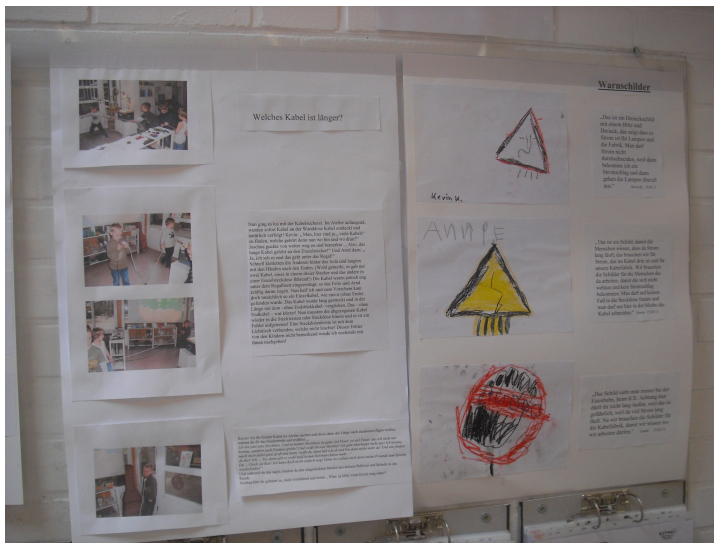
Dokumentation der Ergebnisse im Haupthaus

Inhaltliche Integration: Durch das Suchen und entdecken von „Strom“ in der Kita entsteht eine Neugierde, herauszufinden, wo Strom „benutzt“ wird. Dies wird ständig wieder von den Kindern aufgegriffen und formuliert.