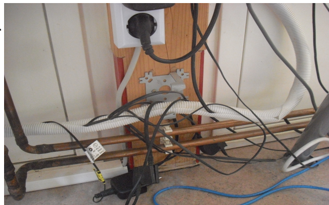
„Soviel Strom? Brauchst Du den wirklich?“ (eine 3-Jährige) - eine gute Frage. Darüber sollten wir reden.

Kinder kennen Elektrizität aus dem Alltag. Überall leuchtet und tönt es. Überall geistern Begriffe wie Strom oder Energie durch die Alltagssprache und somit auch durch den Wortschatz der Kinder. Dabei haben selbst die meisten Erwachsenen nur sehr abstrakte Vorstellungen von dem, was sich hinter den Begriffen verbirgt. Um einen verantwortungsvollen Umgang mit den Ressourcen, die zur Energieerzeugung verwendet werden, zu initiieren, ist es also von Nöten, sich dem Phänomen „Elektrizität“ Schritt für Schritt zu nähern und durch einfache, modellhafte Auseinandersetzung mit der alltäglichen Elektrizität zu nähern um einen nachhaltigen Gebrauch verständlich und durchschaubar zu gestalten. Sobald ein Verständnis für die Natur der Elektrizität aufgebaut wird, können die Kinder sich selbst erarbeiten, wie sie ganz persönlich und subjektiv ressourcenorientiert damit umgehen möchten.